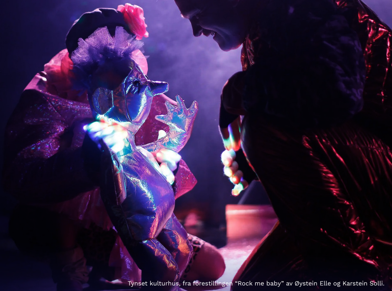
Tynset kulturhus, fra forestillingen "Rock me baby" av Øystein Elle og Karstein Solli.