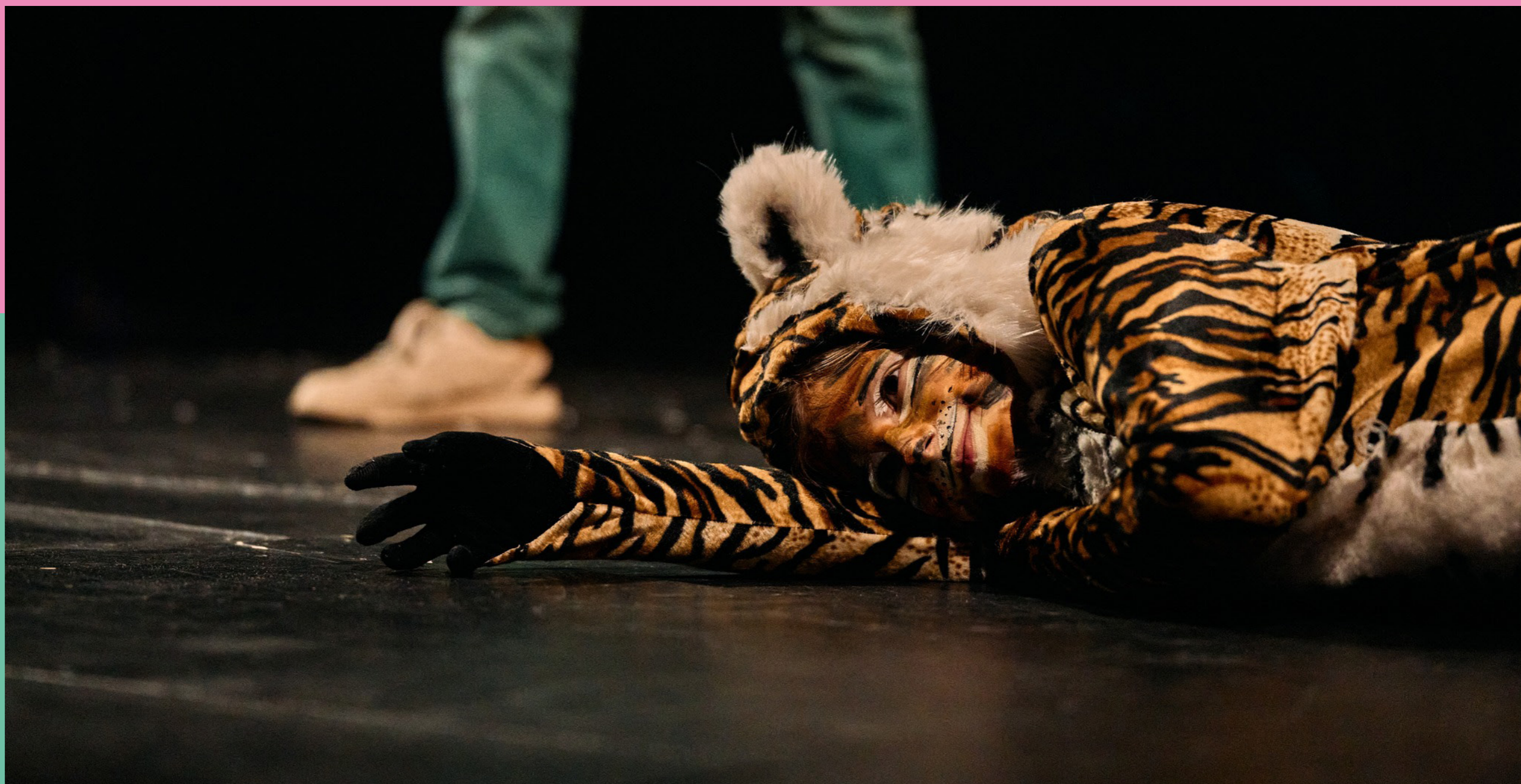
Fra forestillingen Tinka.