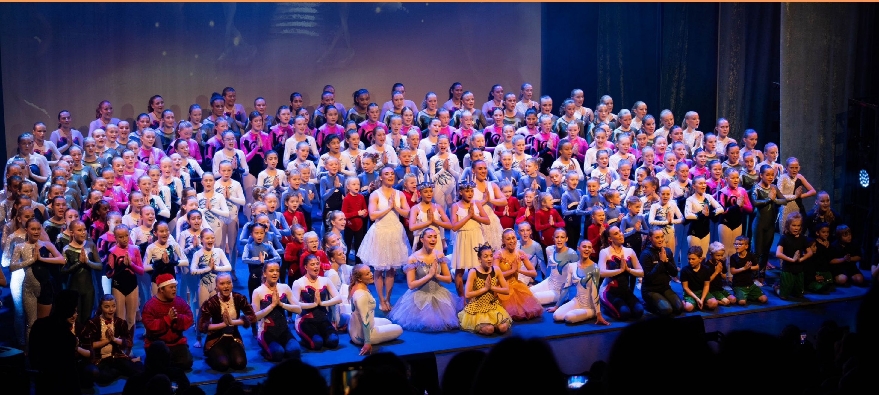
Blå Grotte.